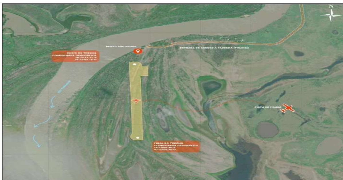
Figura 11 – Imagem Aeródromo de Porto São Pedro.

Por fim, em 2026, as ações concentraram-se na qualificação operacional, na ampliação da capacidade de funcionamento dos aeródromos e na expansão da infraestrutura aeroportuária estadual, destacando-se a contratação de serviços técnicos para análise do pavimento do Aeroporto Regional de Bonito, a implantação de balizamento noturno nos Aeródromos de Inocência e Paranaíba, a adequação da infraestrutura do Aeroporto Regional de Bonito, bem como a implantação de aeródromo no Pantanal, na localidade de Porto São Pedro, no município de Corumbá.