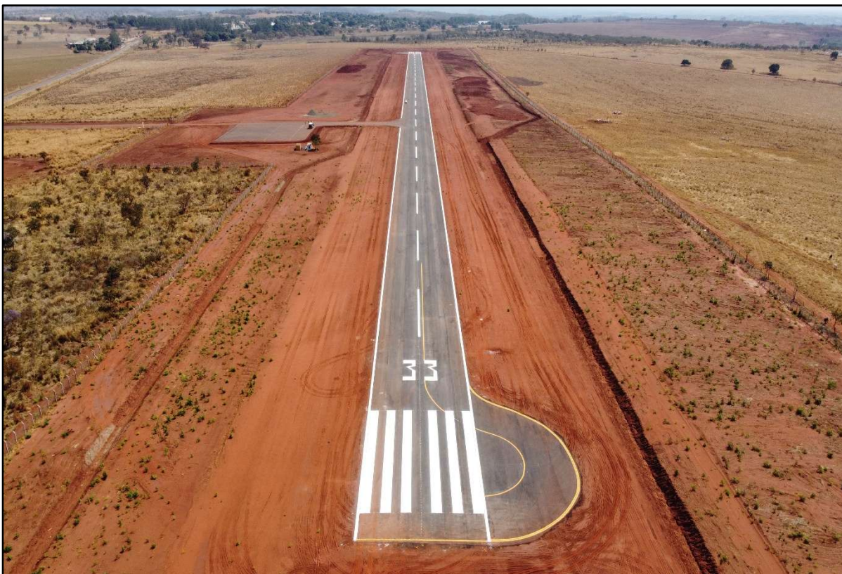
Figura 30 – Restauração do Aeródromo de Camapuã.