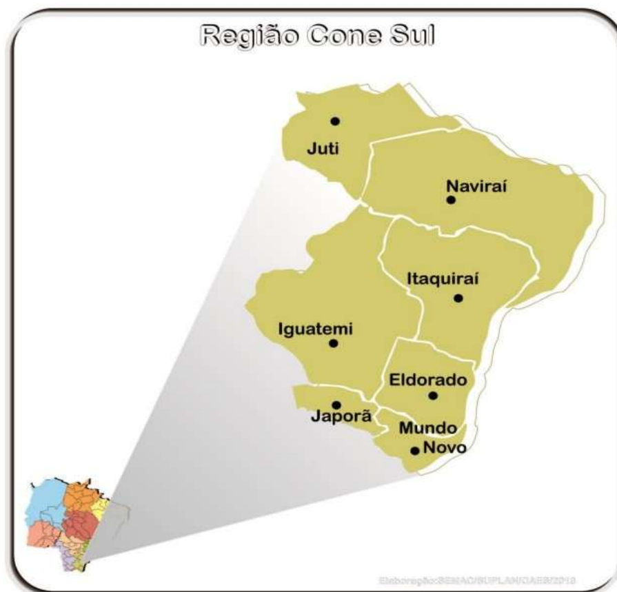
Figura 31 – Ilustração Região Cone Sul.

A Região Cone Sul concentra R$ 25.551.823,61 (vinte e cinco milhões, quinhentos e cinquenta e um mil, oitocentos e vinte e três reais e sessenta e um centavos), com ações em Iguatemi, Mundo Novo e Naviraí, incluindo projeto executivo, implantação de aeródromo, restauração e balizamento noturno com PAPI. A distribuição desses investimentos reforça a diretriz de interiorização da infraestrutura aeroviária.