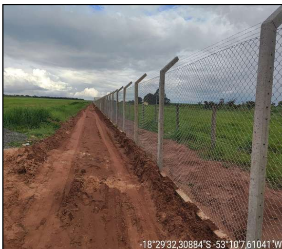
Figura 7 – Alamedado padrão ICAO.

No exercício de 2023, foram desenvolvidas ações voltadas à consolidação inicial da infraestrutura. Destacam-se a implantação de cerca operacional padrão ICAO (International Civil Aviation Organization) no Aeródromo de Costa Rica (SDXJ) e no Aeródromo Rosada (SSGO), em São Gabriel do Oeste. Também foram realizadas a elaboração do relatório técnico das condições do pavimento e as manutenções corretivas e preventivas da infraestrutura do Aeródromo Estância Santa Maria (SSKG), em Campo Grande. O período contemplou, ainda, a elaboração do projeto executivo para a implantação de um novo aeródromo em Maracaju, além de manutenções corretivas e preventivas na infraestrutura do Aeroporto Regional de Bonito (SBDB).