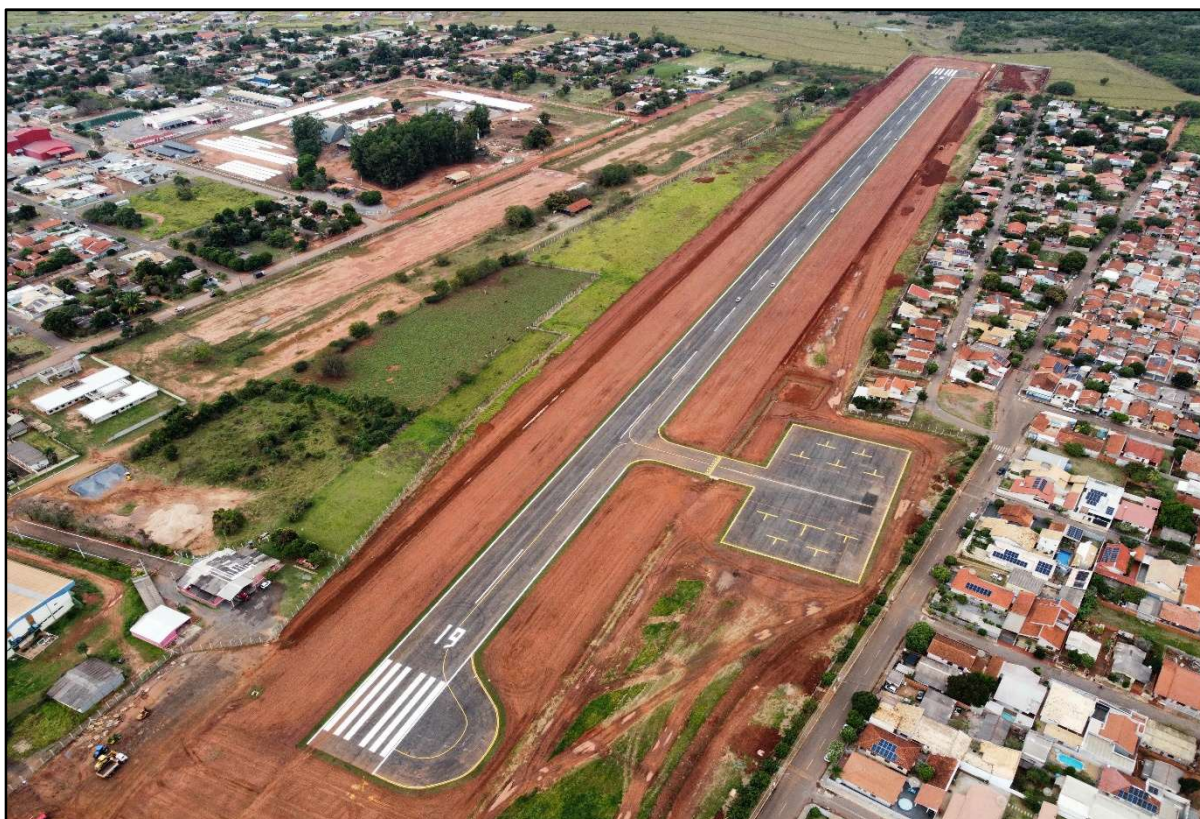
Figura 27 – Restauração do Aeródromo de Jardim.