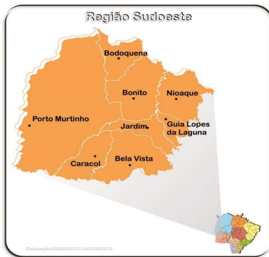
Figura 25 – Ilustração Região Sudoeste.

A Região Sudoeste reúne investimentos de R$ 22.278.647,74 (vinte e dois milhões, duzentos e setenta e oito mil, seiscentos e quarenta e sete reais e setenta e quatro centavos), distribuídos entre Bonito, Jardim, Bela Vista e Porto Murtinho, com ações que abrangem desde substituição de cobertura de terminal, manutenção de sistemas e medições técnicas até restauração de aeródromo e implantação de balizamento noturno e PAPI. A região possui importância estratégica tanto para a aviação regional quanto para o turismo e a integração fronteiriça.