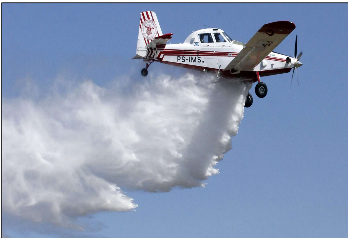
Figura 24 – Aeronave de combate a incêndio Air Tractor.