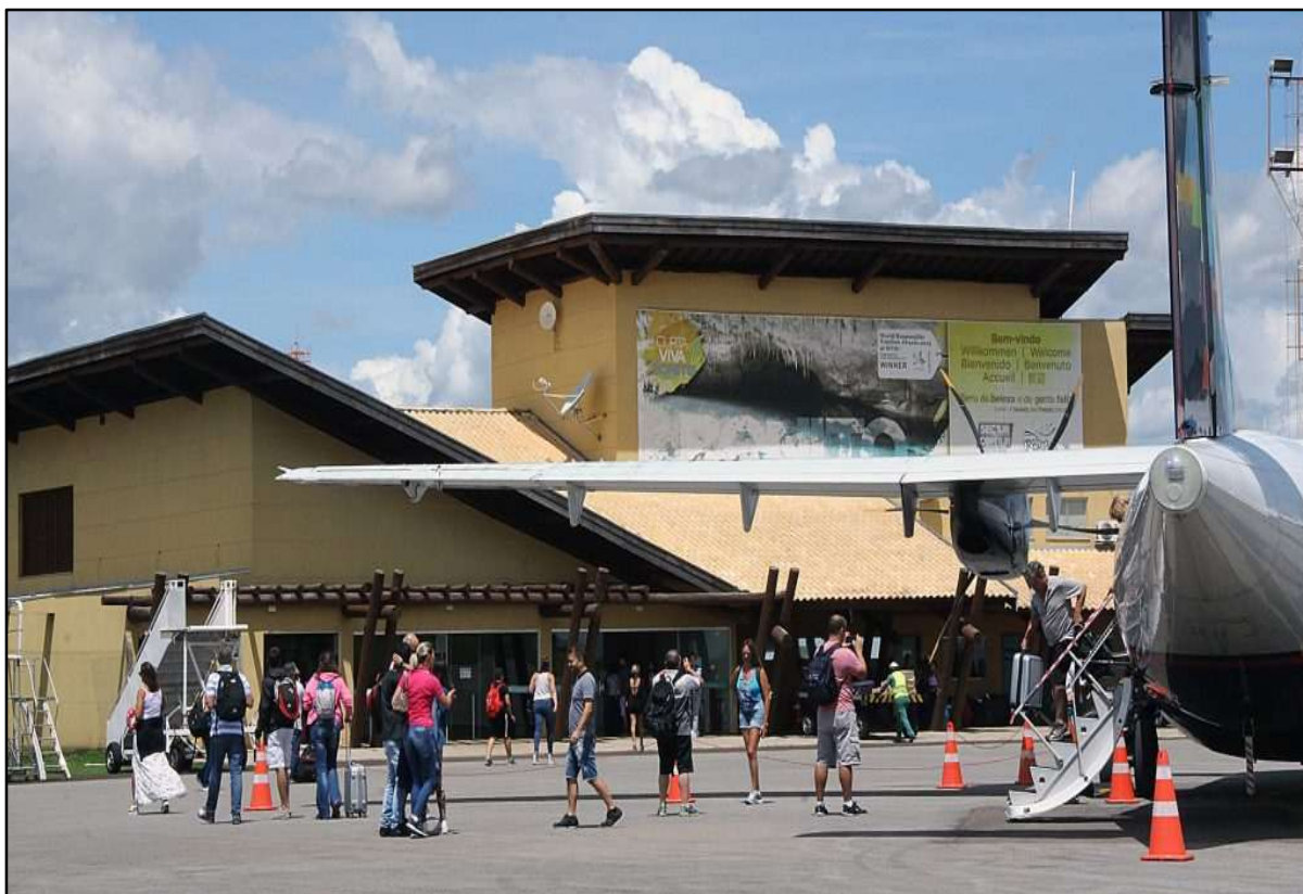
Figura 26 – Terminal de Passageiros Aeroporto Regional de Bonito.