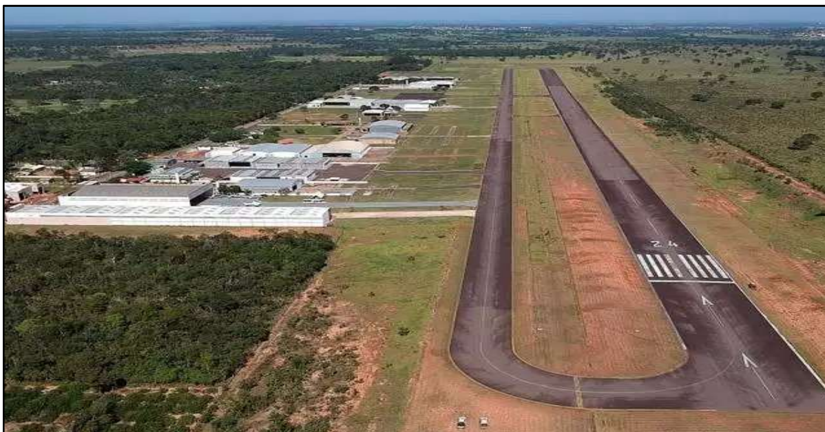
Figura 9 – Aeródromo Estância Santa Maria.

No exercício de 2025, foram executadas ações voltadas tanto à recuperação quanto à ampliação da infraestrutura estadual, incluindo a restauração do Aeródromo de Jardim SSJI, a implantação do aeródromo de Água Clara, a implantação do aeródromo em Maracaju, a manutenção preventiva e corretiva do sistema de balizamento noturno no Aeródromo Estância Santa Maria SSKG, a construção do Terminal de Passageiros (TPS) e edificações auxiliares do aeroporto de Dourados SBDO, além da implantação de cerca operacional padrão ICAO no Aeródromo de Aquidauana.