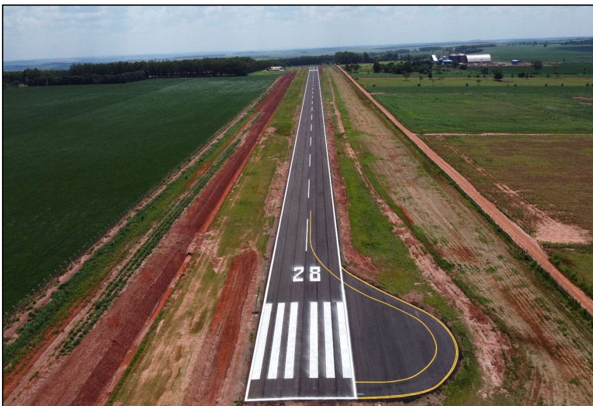
Figura 33 – Restauração Aeródromo de Naviraí.