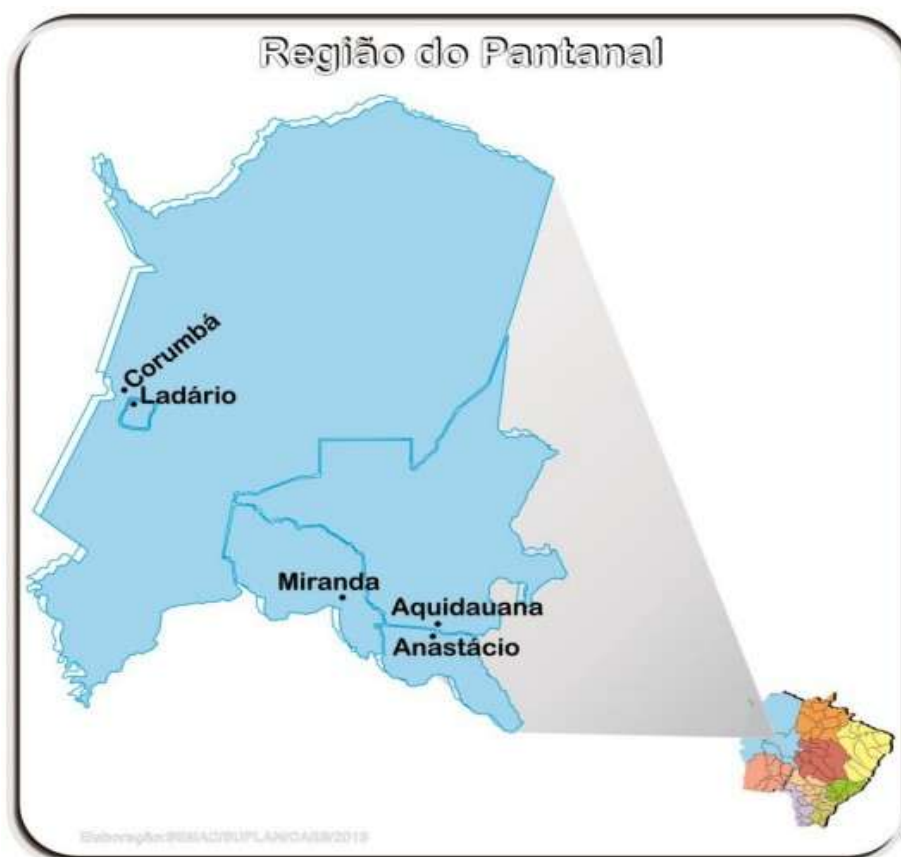
Figura 22 – Ilustração Região do Pantanal

No Pantanal, os investimentos totalizam R$ 49.484.821,33 (quarenta e nove milhões, quatrocentos e oitenta e quatro mil, oitocentos e vinte e um reais e trinta e três centavos), com intervenções em Aquidauana e Corumbá, incluindo cercamento operacional, projetos executivos e implantação de aeródromos. Trata-se de região de elevada relevância logística, em razão de suas características territoriais e da necessidade de ampliar a conectividade em áreas de difícil acesso.