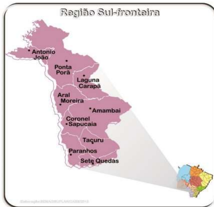
Figura 34 – Ilustração Região Sul-fronteira.

Por sua vez, a Região Sul-Fronteira apresenta investimentos de R$ 18.862.413,03 (dezoito milhões, oitocentos e sessenta e dois mil, quatrocentos e treze reais e três centavos), todos previstos para Amambai, envolvendo aquisição de área, projeto executivo e implantação de aeródromo, o que revela uma estratégia de estruturação futura da infraestrutura aeroportuária regional.