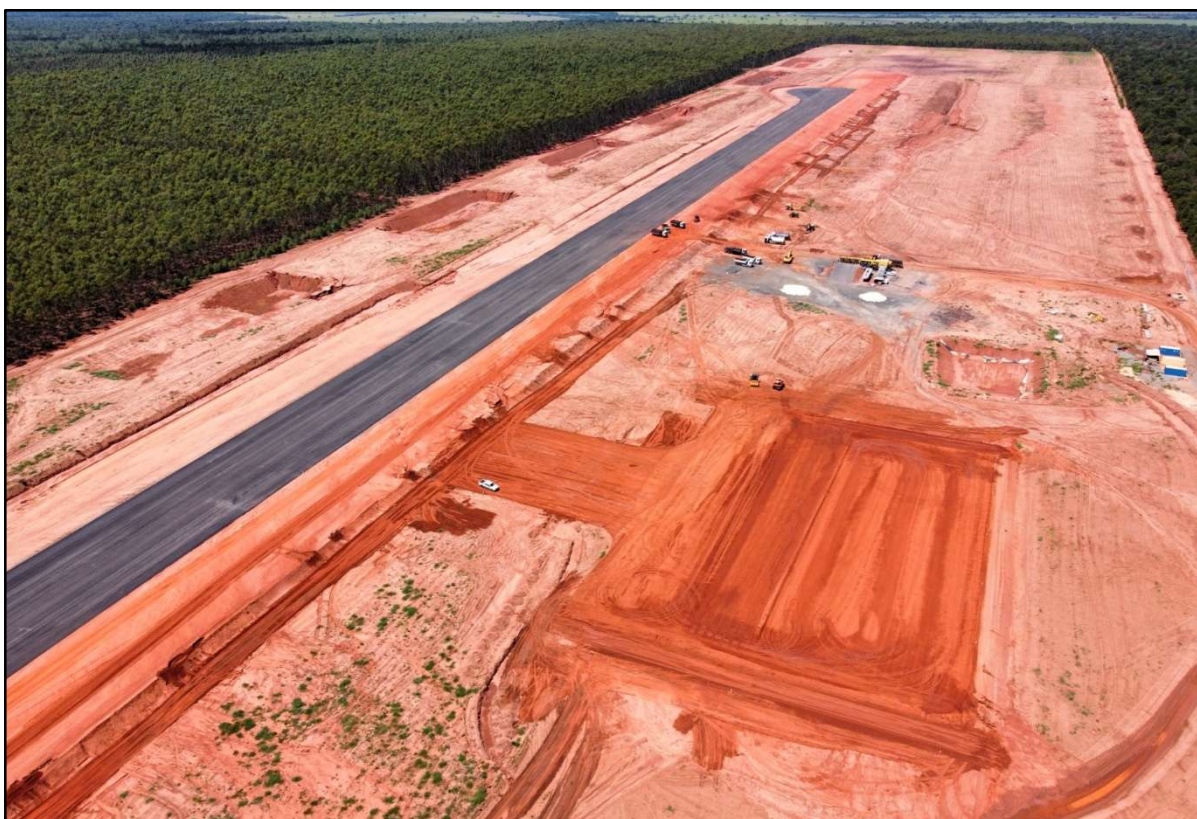
Figura 15 – Implantação de Aeródromo em Água Clara.