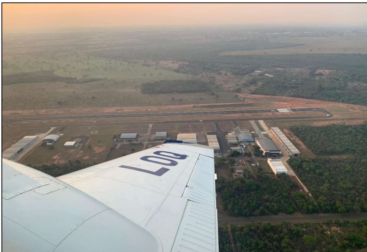
Figura 17 – Aeródromo Estância Santa Maria.