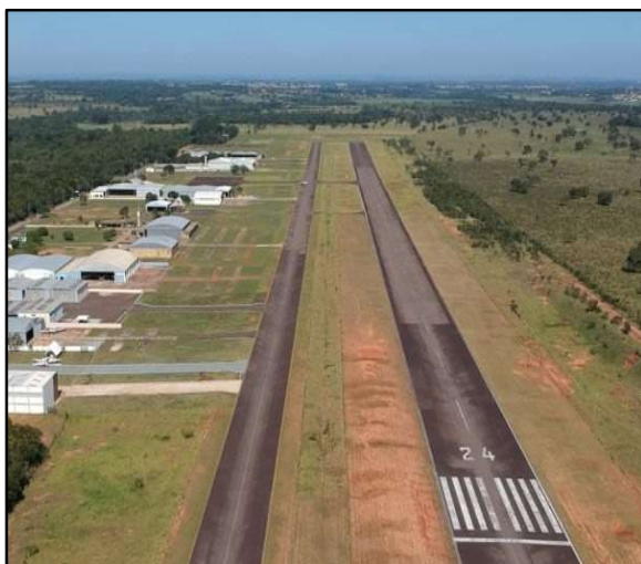
Figura 2 – Aeródromo Estância Santa Maria.

Antes da consolidação do Plano, a malha aeroviária estadual apresentava um quadro heterogêneo, com diferenças significativas entre os aeródromos quanto à disponibilidade de infraestrutura, ao nível de estruturação física e à capacidade operacional. Enquanto alguns aeródromos já dispunham de condições mínimas de funcionamento e regularidade operacional, outras ainda dependiam de intervenções básicas de adequação, segurança, recuperação e suporte técnico. Em diversos casos, verificavam-se limitações relacionadas à insuficiência de cercamento operacional, desgaste de pavimentos, carência de melhorias em áreas de apoio, ausência de auxílios visuais à navegação e necessidade de ações permanentes de manutenção e modernização.