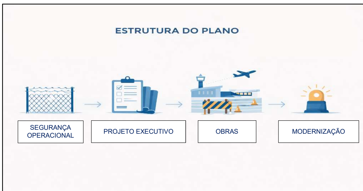
Figura 6 – Ilustração da Estrutura do Plano.

A estrutura do Plano Logístico Aeroviário do Estado de Mato Grosso do Sul foi organizada a partir de uma lógica progressiva de investimentos, orientada pela necessidade de preparar tecnicamente a área dos aeródromos para intervenções de maior complexidade e garantir que a expansão da infraestrutura ocorresse de forma segura, planejada e operacionalmente consistente. Nesse modelo, o desenvolvimento da malha aeroviária não se dá por ações isoladas, mas por etapas sucessivas e complementares, em que cada intervenção cria as condições necessárias para o avanço da etapa seguinte.