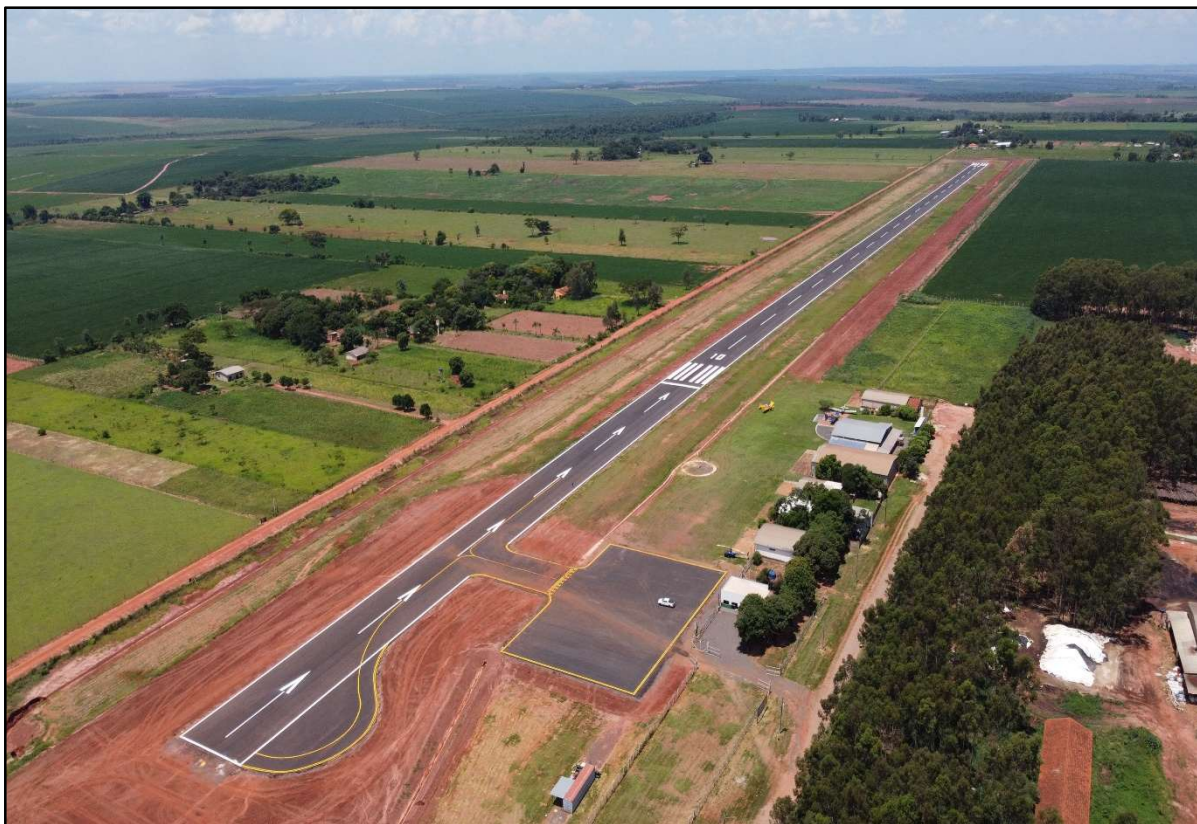
Figura 32 – Restauração Aeródromo de Naviraí.