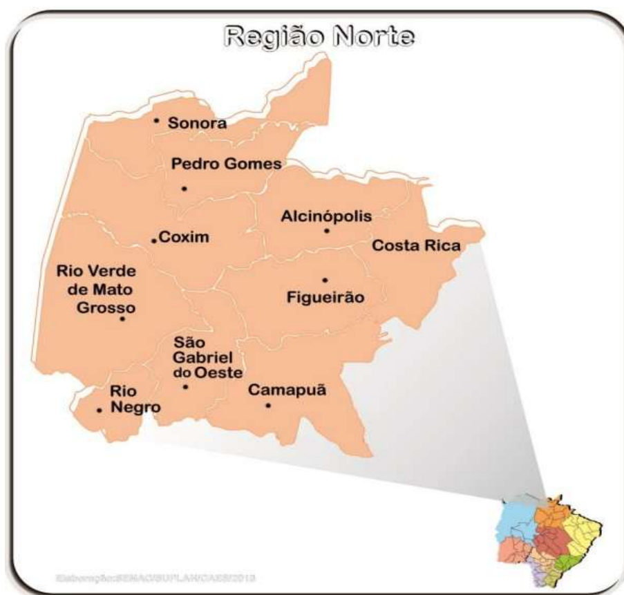
Figura 28 – Ilustração Região Norte.

Na Região Norte, os investimentos somam R$ 35.239.524,30 (trinta e cinco milhões, duzentos e trinta e nove mil, quinhentos e vinte e quatro reais e trinta centavos), alcançando Camapuã, Costa Rica, Coxim e São Gabriel do Oeste. As intervenções incluem implantação de alambrado padrão ICAO, restauração de aeródromos e previsão de implantação de balizamento noturno e pavimentação asfáltica, contribuindo para a ampliação da infraestrutura regional.