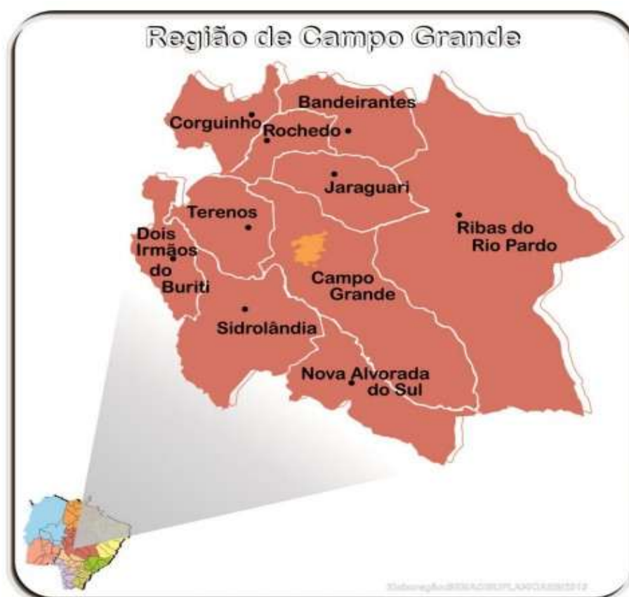
Figura 16 – Ilustração Região de Campo Grande.

Na Região Campo Grande, os investimentos somam R$ 61.291.429,14 (sessenta e um milhões, duzentos e noventa e um mil, quatrocentos e vinte e nove reais e quatorze centavos), com ênfase em ações voltadas ao Aeródromo Estância Santa Maria (SSKG), além de investimentos previstos em Ribas do Rio Pardo e Sidrolândia. A região se destaca pela presença de intervenções de planejamento, restauração, ampliação e manutenção de sistemas de balizamento noturno.