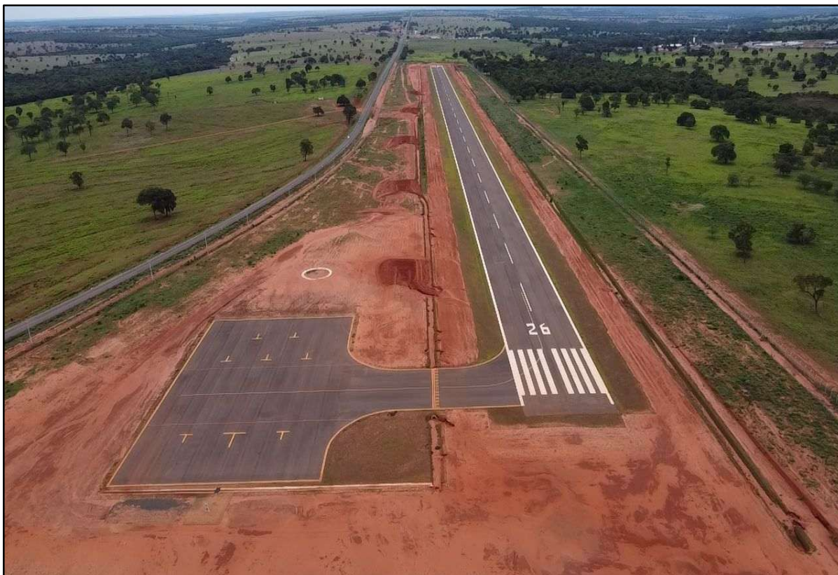
Figura 14 – Aeródromo de Inocência.