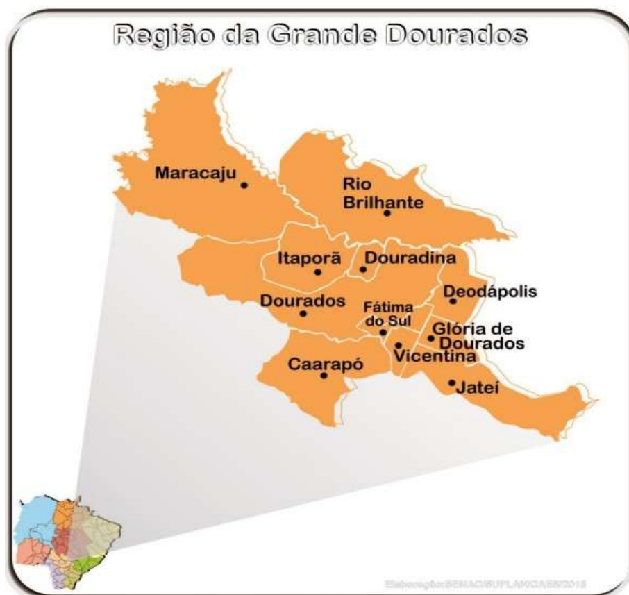
Figura 19 – Ilustração Região Grande Dourados.

A Região Grande Dourados também apresenta expressiva participação no Plano, com investimentos da ordem de R$ 67.707.095,13 (sessenta e sete milhões, setecentos e sete mil, noventa e cinco reais e treze centavos), abrangendo especialmente os municípios de Dourados e Maracaju. Nessa região, destacam-se a construção do terminal de passageiros e edificações auxiliares do Aeroporto de Dourados e a implantação do aeródromo de Maracaju, além de ações futuras relacionadas a balizamento noturno e infraestrutura complementar.