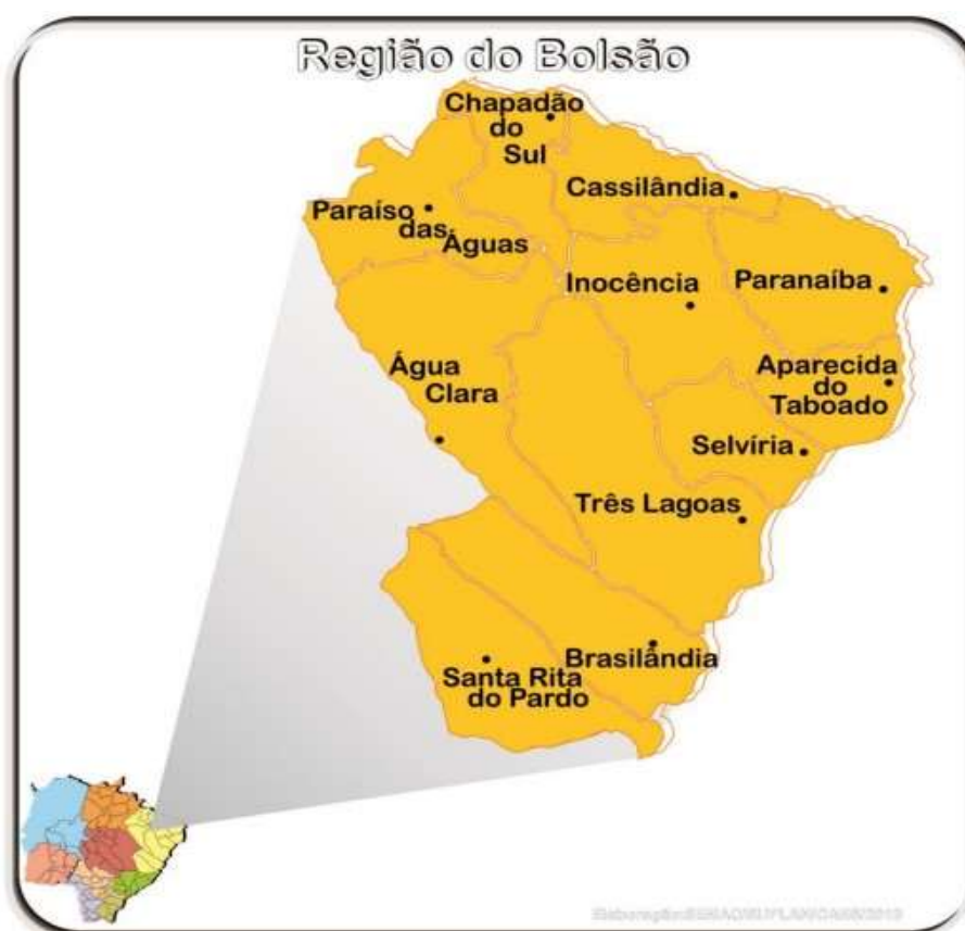
Figura 13 – Ilustração Região do Bolsão.

A Região do Bolsão destaca-se entre as áreas com maior volume de investimentos, concentrando ações executadas, em execução e previstas, com destaque para intervenções em Água Clara, Cassilândia, Inocência, Paranaíba, Aparecida do Taboado e Três Lagoas, totalizando R$ 79.201.033,30 (setenta e nove milhões, duzentos e um mil, trinta e três reais e trinta centavos). Nessa região, sobressaem obras de implantação de aeródromos, restauração de infraestrutura e implantação de balizamento noturno.