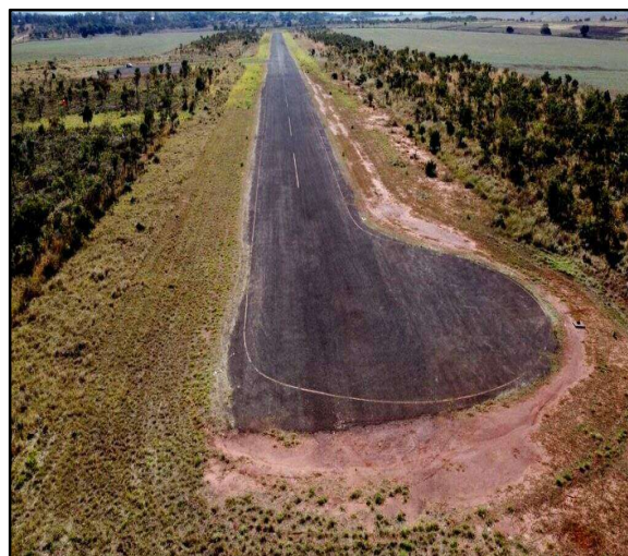
Figura 3 – Aeródromo de Camapuã.

Esse panorama evidenciava a necessidade de superar uma lógica de intervenções pontuais e fragmentadas, substituindo-a por uma abordagem estruturada, orientada por critérios técnicos, priorização estratégica e planejamento de médio e longo prazo. Foi nesse contexto que o Plano Logístico Aeroviário passou a se consolidar como ferramenta de organização da atuação estatal no setor, permitindo identificar gargalos, hierarquizar demandas, racionalizar investimentos e estabelecer uma trajetória contínua de qualificação e expansão da infraestrutura aeroportuária.