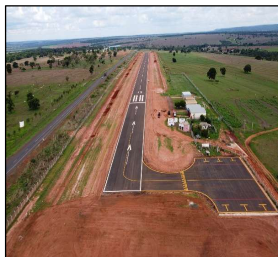
Figura 5 – Aeródromo de Cassilândia.

O Plano também se orienta para a ampliação da capacidade operacional dos aeródromos estaduais, inclusive com a incorporação de soluções que possibilitem a expansão da janela de funcionamento, como a implantação de sistemas de balizamento noturno e outros dispositivos de apoio à navegação aérea. Paralelamente, pretende criar bases mais consistentes para o fortalecimento da aviação regional, contribuindo para o atendimento de demandas logísticas, institucionais, emergenciais e produtivas em diferentes áreas do Estado.