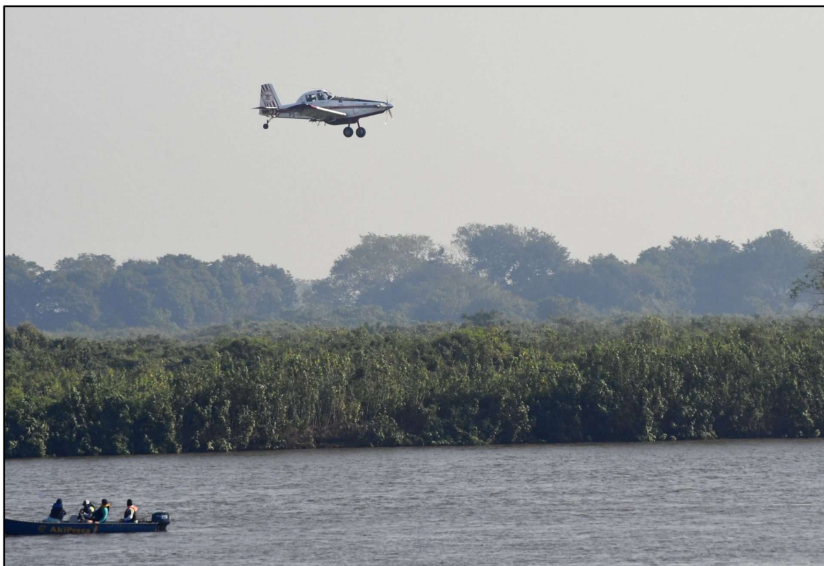
Figura 23 – Aeronave de combate a incêndio Air Tractor.