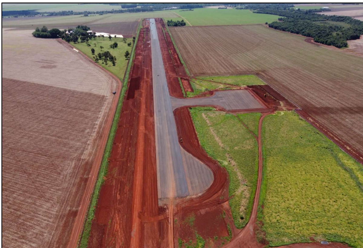
Figura 21 – Implantação de Aeródromo em Maracaju.