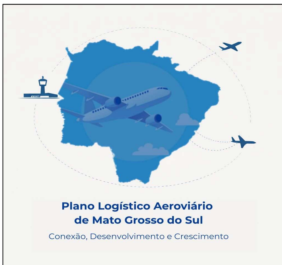
Figura 1 – Ilustração Plano Logístico Aeroviário de Mato Grosso do Sul.

O Plano Logístico Aeroviário do Estado de Mato Grosso do Sul foi concebido como instrumento estratégico de planejamento e gestão, destinado a orientar, de forma técnica e integrada, o desenvolvimento da infraestrutura aeroportuária estadual. Sua formulação decorre do reconhecimento de que o transporte aéreo constitui elemento essencial para a integração territorial, o fortalecimento da logística regional e o apoio ao desenvolvimento econômico e social do Estado.