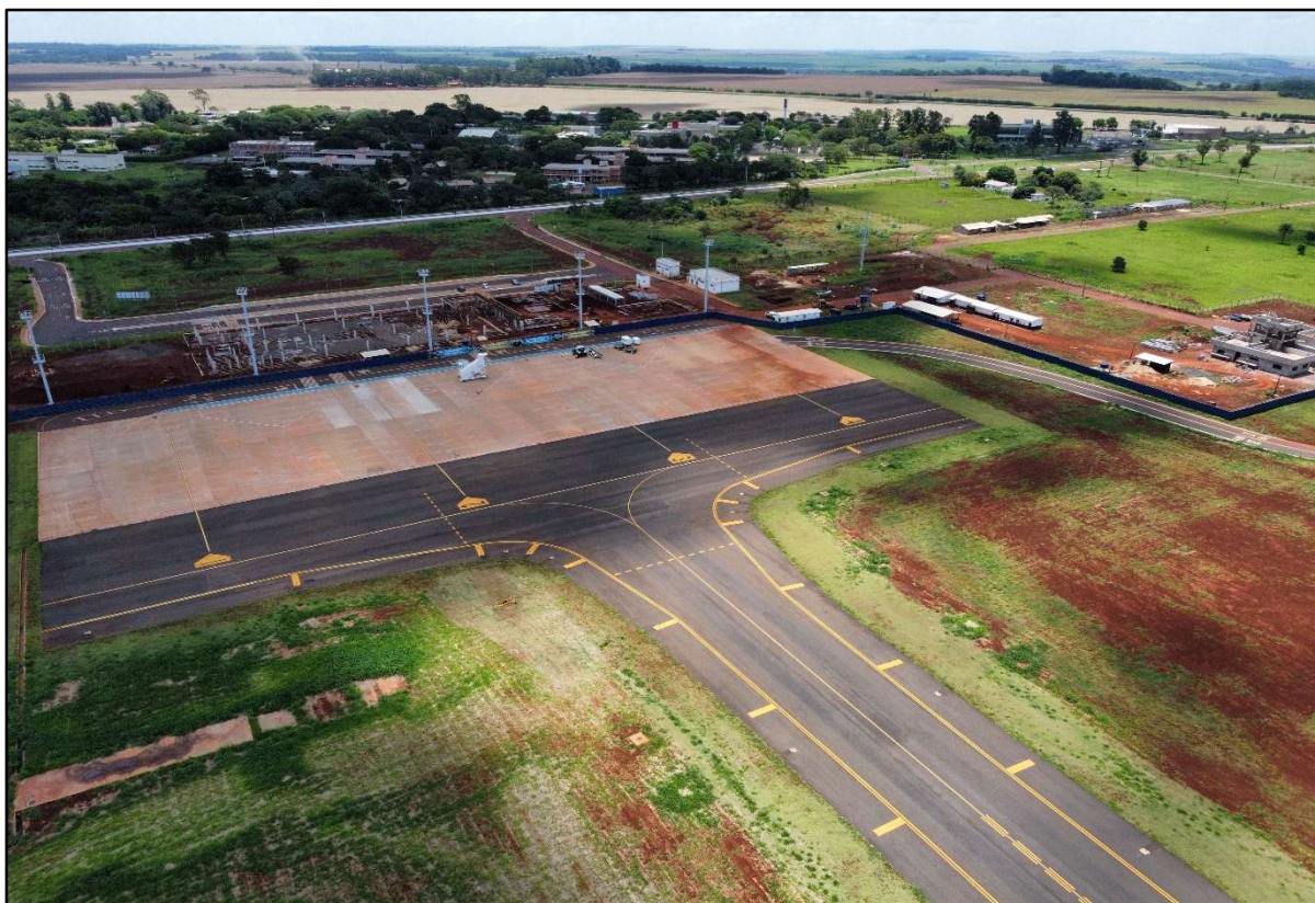
Figura 20 – Implantação de Terminal de Passageiros Aeroporto de Dourados.