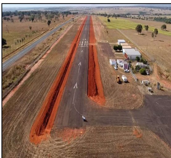
Figura 4 – Aeródromo de Cassilândia.

Em termos específicos, o Plano busca promover a expansão e a qualificação da rede aeroportuária, assegurando maior integração entre as diferentes regiões do território sul-mato-grossense e ampliando as condições de acesso e mobilidade aérea. Busca, igualmente, elevar os níveis de segurança operacional, mediante a adequação da infraestrutura aeroportuária aos parâmetros técnicos e regulatórios aplicáveis, bem como recuperar e modernizar estruturas existentes, de modo a garantir melhores condições de funcionamento, maior confiabilidade operacional e continuidade dos serviços prestados.