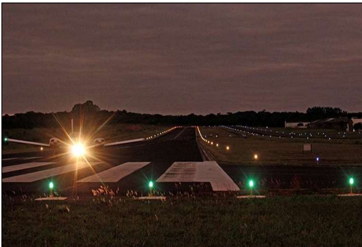
Figura 18 – Balizamento Noturno Aeródromo Estância Santa Maria.