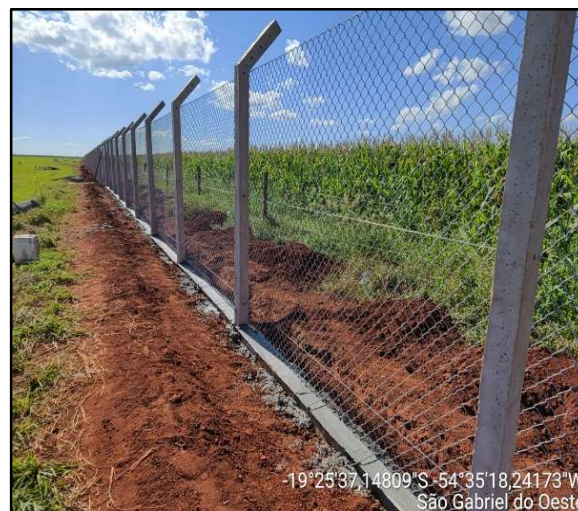
Figura 8 – Alamedado padrão ICAO.

Em 2024, o Plano de Ação avançou para intervenções de maior porte, contemplando a elaboração de projeto executivo para Ampliação e Restauração da Pista de Pouso e Decolagem (PPD), taxiway e pátio do Aeródromo Estância Santa Maria SSKG, bem como projeto executivo para implantação de aeródromo no Pantanal na região da Nhecolândia em Corumbá. No mesmo período, destacaram-se a aquisição de equipamento para a segurança operacional do Aeroporto Regional de Bonito, a restauração do pavimento asfáltico do Aeródromo de Camapuã, a implantação de um Aeródromo no município de Inocência, além da restauração dos pavimentos dos Aeródromos de Paranaíba SSPN, Cassilândia SSCL e Naviraí SSNB.